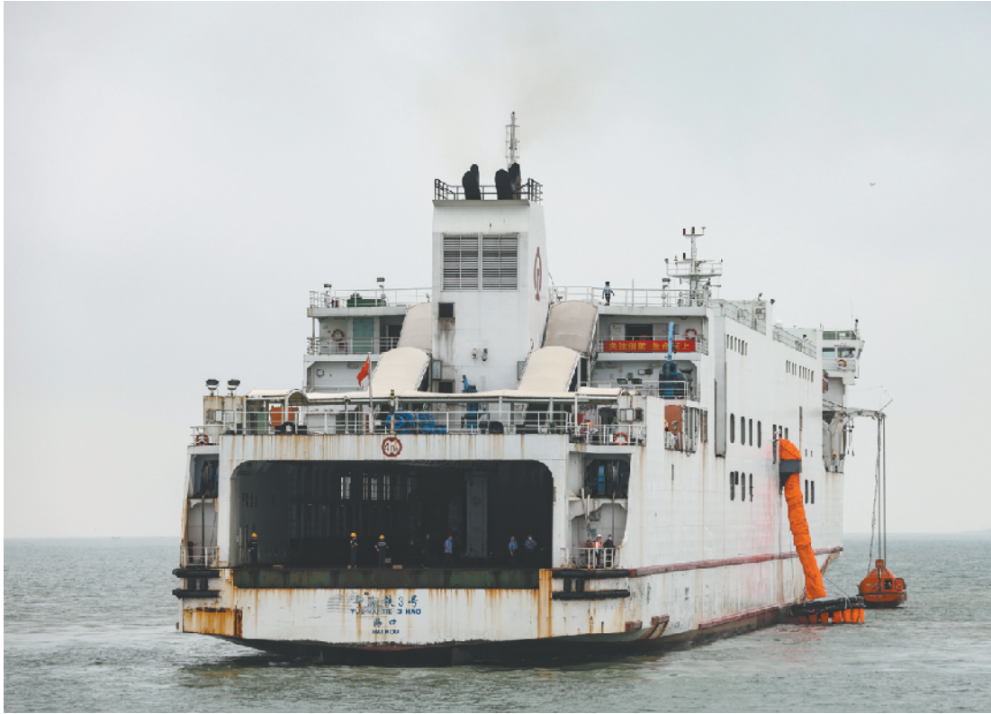
11 月 17 日，火车轮渡在演练释放快速垂直撤离系统和救生艇组织遇险旅客撤离。当日，2020 年琼州海峡火车轮渡海上应急救助综合演练在海口秀英港举行，本次演练课目包括人员救助、海上大规模人员转移、船舶应急消防等。