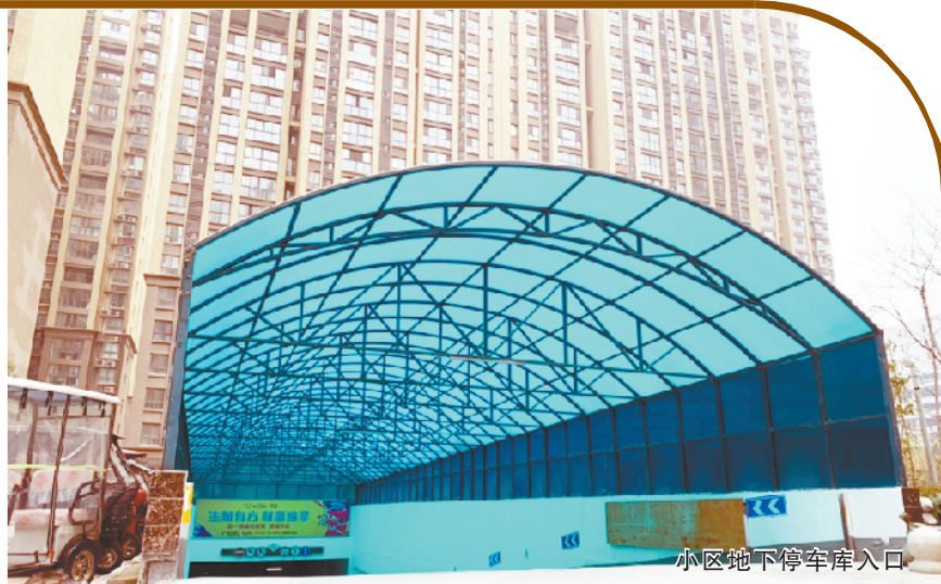
小区地下停车库入口