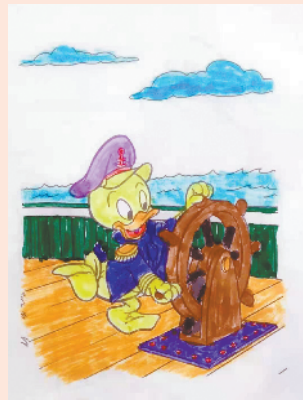
小记者：马于雅 编号：201063 周口七一路二小 二(4)班