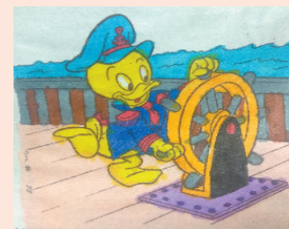
小记者：滕若伊 编号：202706 周口六一路小学 二(6)班