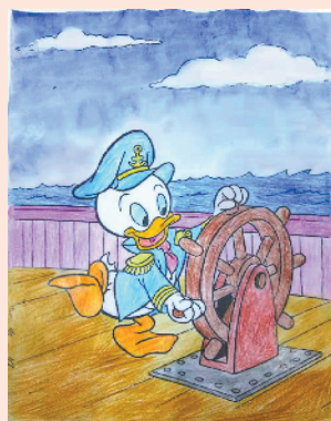
小记者：魏子恩 编号：202690 周口六一路小学 二(6)班