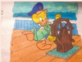
小记者：王洛妃 编号：202735 周口六一路小学 二(9)班