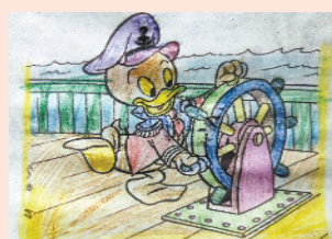
小记者：陈龙优 编号：201927 周口李庄小学 三(3)班