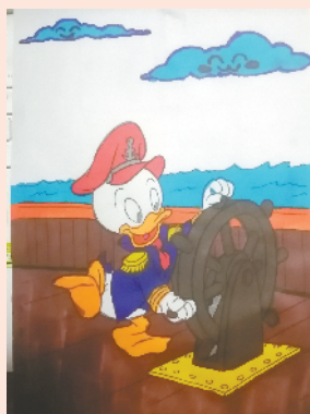
小记者：叶昕桐 编号：201231 周口八一路二小 二(4)班