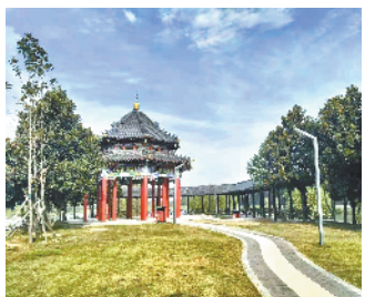
周口植物园湖心亭