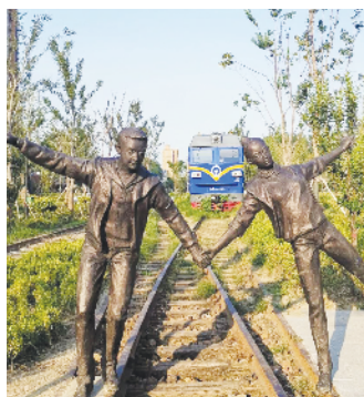
周口铁路主题公园