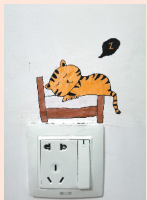
小记者：普沛琪 证号：200117 周口五一路小学三一班