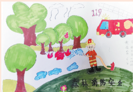
小记者：谢依霏 证号：211119 周口实验小学一（1）班