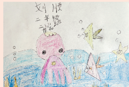
小记者：刘顺 证号：211160 周口实验小学二（1）班