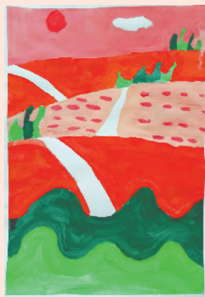
小记者：刘顺 证号：211160 周口实验小学二（1）班

本栏目刊发小记者的书法、绘画、摄影等作品。小记者们如果有这些爱好，快快行动起来吧！作品完成后，请用相机拍下并发送到zkwbxjz@126.com。