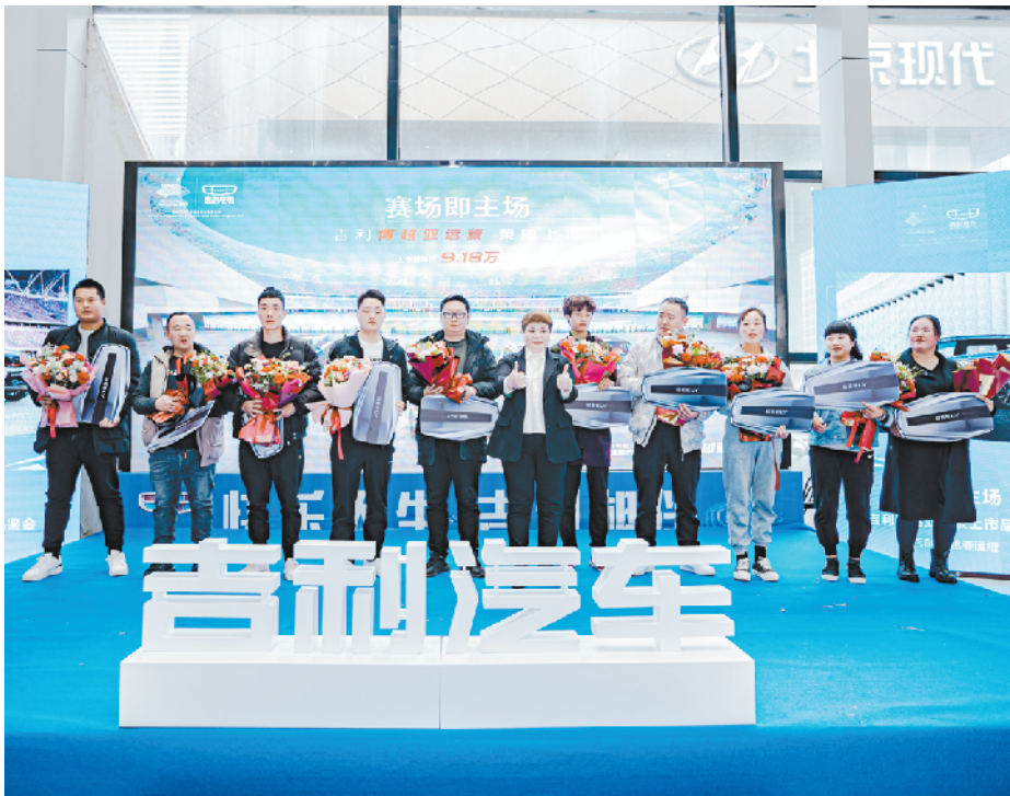
图为吉利博越亚运版预售期间购车的客户。

动力上,吉利博越亚运版搭载了 1.8TD+7DCT 黄金动力组合,超强动力表现,使其在 20 万以内 A 级 SUV 明星车型中一枝独秀。搭载的第三代 1.8TD 涡轮增压发动机,最大功率 135kW,峰值扭矩 300N·m,匹配的 7DCT 湿式双离合变速器,由吉利和沃尔沃共同研发,拥有同级最高 97% 的传输效率,0.2s 极速换挡,经济性提升高达 20%。经过市场充分验证,这组黄金动力完美匹配,油耗低至 7.7L/100km。