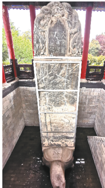
大宋重修太清宫之碑