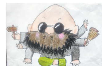
小记者:杨诗韵 证号:201705 周口经开区实验学校二(1)班