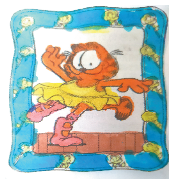
小记者:张越涵 证号:210490 周口李庄小学一(3)班