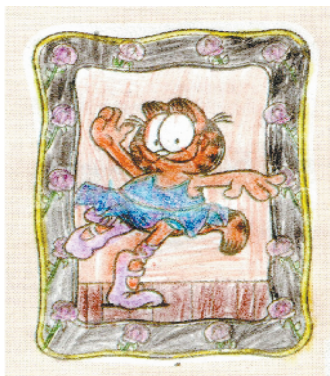
小记者:舒心 证号:211671 周口七一路二小二(5)班