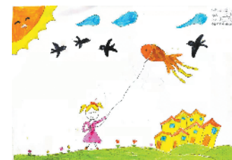
小记者:程心仪 证号:210167 周口开元路小学一(3)班