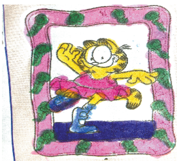
小记者:王小菲 证号:211000 周口闫庄小学一(1)班