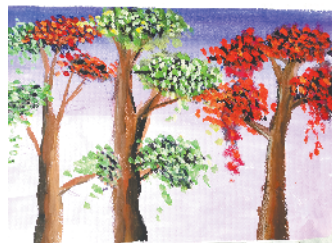
小记者:朱子歌 证号:201060 周口七一路二小二(4)班

本栏目刊发小记者的书法、绘画、摄影等作品。小记者们如果有这些爱好,快快行动起来吧!作品完成后,请用相机拍下并发送到zkwbxjz@126.com。