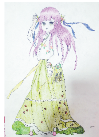
小记者:张寒月 证号:210643 周口榆树园小学四(1)班