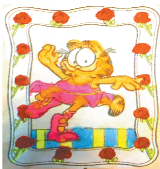
小记者:李一诺 证号:212025 周口六一路小学一(6)班