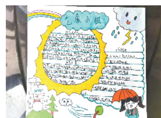
小记者:袁婉丘 证号:210899 周口经开区盛和小学四(4)班