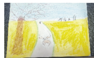
小记者:马于雅 证号:211666 周口七一路二小二(4)班