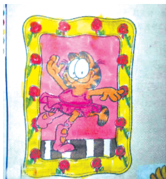
小记者:靳姝禾 证号:210221 周口五一路小学一(8)班