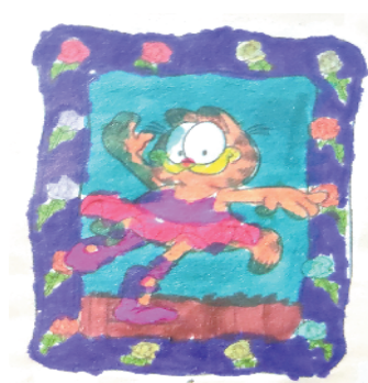
小记者:滕若伊 证号:212150 周口六一路小学二(6)班