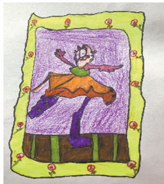
小记者:孙羲尧 证号:210698 周口经开区开来路小学一(2)班