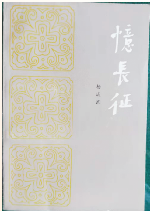
杨成武的回忆录《忆长征》一书,由叶剑英元帅题写书名,聂荣臻元帅作序。序言写到,红四团在长征中先后由耿飈、卢子美和王开湘同志任团长,由杨成武同志任政委。

4月9日,周口日报《红色记忆》采访组一行再次来到沈丘县李老庄乡卢子美家乡采访,并到卢子美的墓前凭吊。当时,卢子美墓碑前摆放了一盆白色菊花,花朵在风中摇曳,像是在倾诉着什么。“应该是有人专程过来扫墓了。”卢远东拿起那盆菊花,细心地擦拭底部尘土。他说:“爷爷去世多年,给我们留下了无穷尽的精神财富。勤俭是我们的传家宝,气节是我们做人的标本,诚信待人也是爷爷对我的教导。我们后人要把党的初心传承发扬光大。”③6