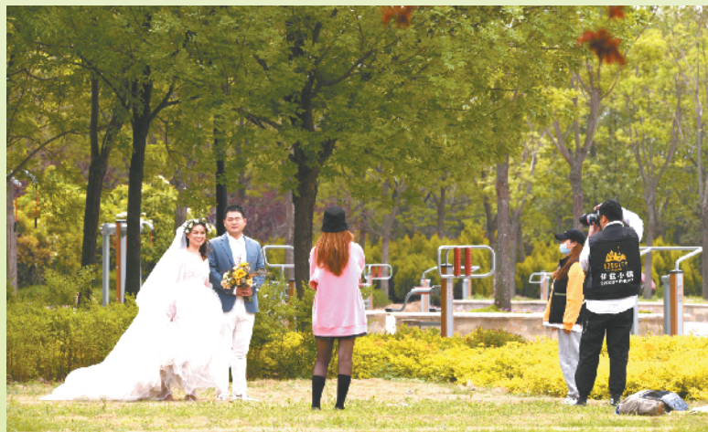
游园绿树下情侣快乐拍照

碧水蓝天皆风景,绿树映衬翠满园。如今的周口城,绿树春意盎然,花草娇艳可人,河水碧波荡漾,市民心情舒畅,处处充满园林的优雅和蓬勃的生机。我们坚信,随着今后城市绿化日臻完善、城市品位逐年提升、人居环境不断改观,未来的周口会逐渐演变成一座现代化的绿色宜居、生态文明、温馨浪漫之城。