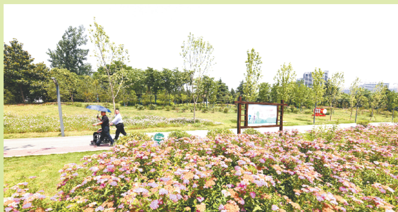
游人徜徉于绿树繁花间