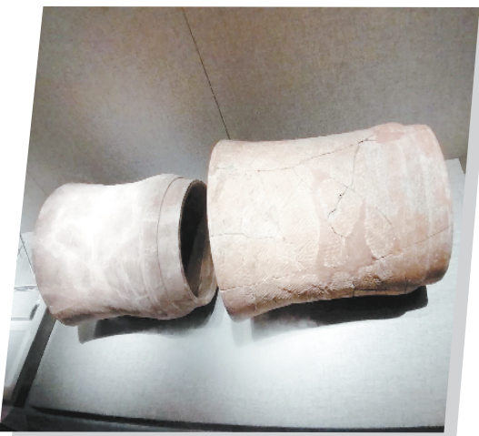
以上三图均为当时发现龙山时期陶排水管道的情形