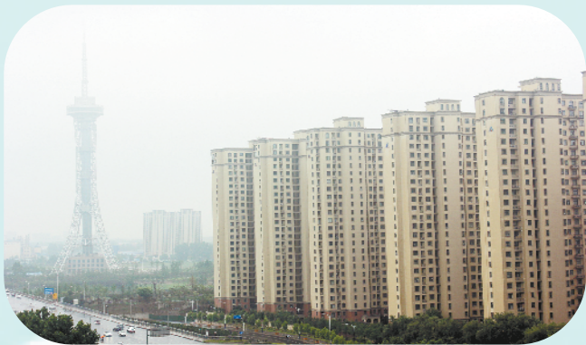
以米黄色为主的滨河地带