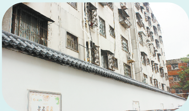
粉墙黛瓦的老小区