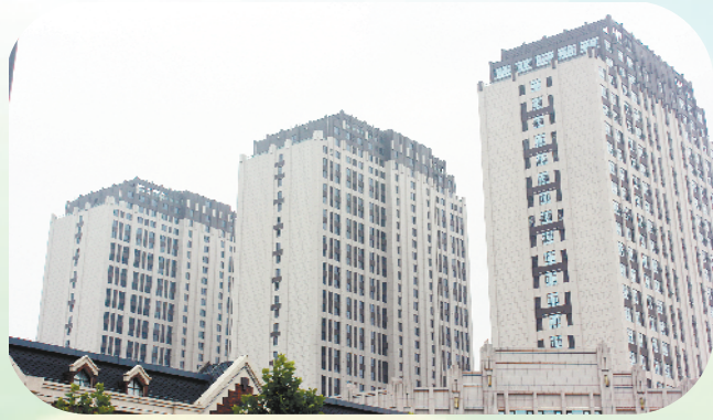
东部新城区新建楼宇外立面为灰色