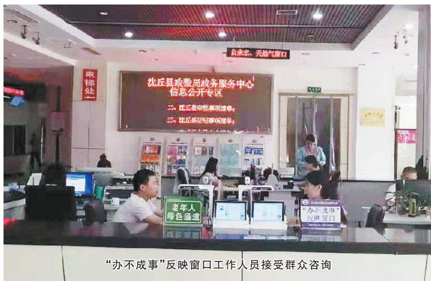
“办不成事”反映窗口工作人员接受群众咨询

近几年,沈丘县政务服务和大数据管理局进行多轮政务服务改革,基本实现政务服务事项办理“一门、一网、一窗、一次”。但是,受制于既有规则和窗口人员的权限,群众有时办起事来会比较纠结和繁琐。为此,该局专门在县政务服务大厅设置了“办不成事”窗口,主要受理因政策、系统、材料等客观因素,以及咨询、受理、踏勘等政务服务主观因素造成的企业、群众多次办、办事体验差、办理效果差或办不成等问题。该窗口开通了投诉电话、邮件信箱、意见箱等问题反映渠道,充分发挥政务服务部门协调