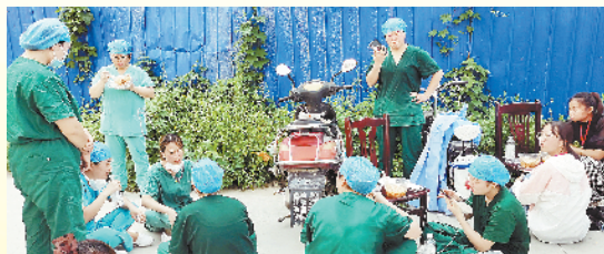
队员们轮流就地吃盒饭充饥、喝矿泉水解渴