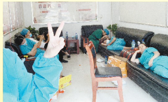
队员们在沙发上休息