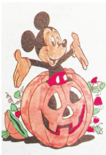
小记者：马康雅 证号：210239 周口五一路小学三（5）班