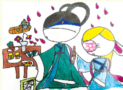
小记者：王小菲 证号：211000 周口闫庄小学二（2）班