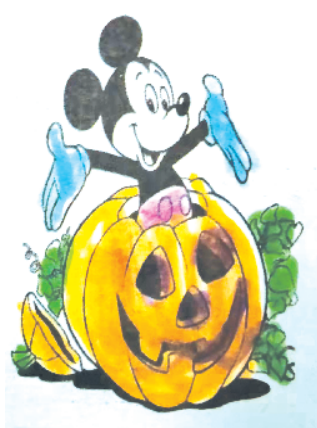
小记者：胡晨曦 证号：212865 周口经开区实验学校二（1）班