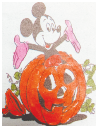
小记者：王泽昕 证号：211051 周口闫庄小学三（1）班