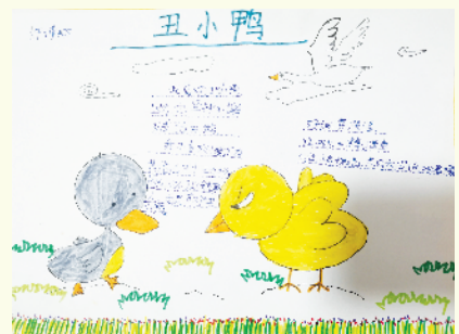
小记者：许博翔 证号：211646 周口七一路二小二（3）班