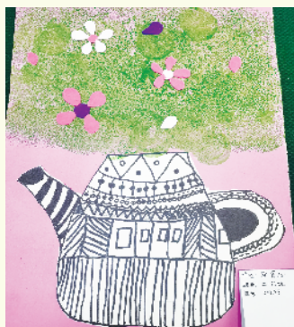
小记者：邓景心 证号：210199 周口五一路小学二（6）班