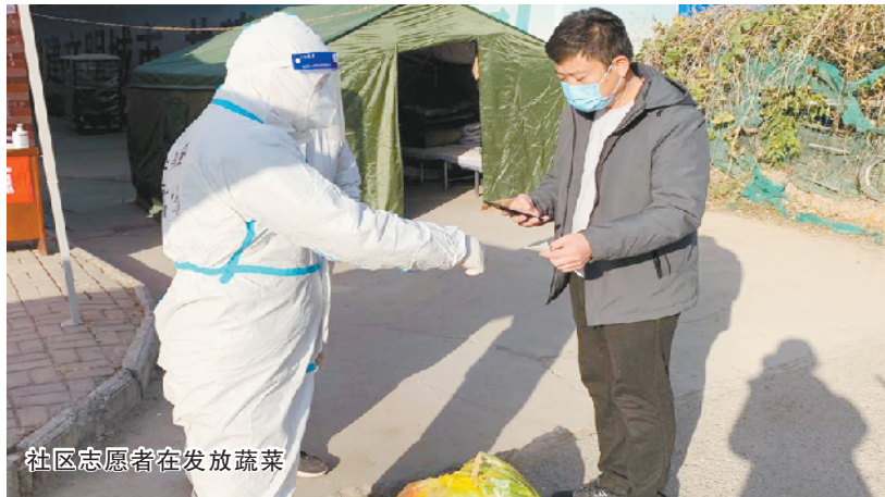
社区志愿者在发放蔬菜

服地说。原来是一位 64 岁的老大爷志愿者,他主要负责运送核酸检测的医疗垃圾。由于时间紧急,还有别的采访任务,我们忙问了老大爷的姓名和联系方式,以便后续采访,他却摆了摆手说:“不用问我的姓名,我明天还在这儿哩,这会儿急着工作,你们明天再来吧。”颇有“扫地僧”的感觉。