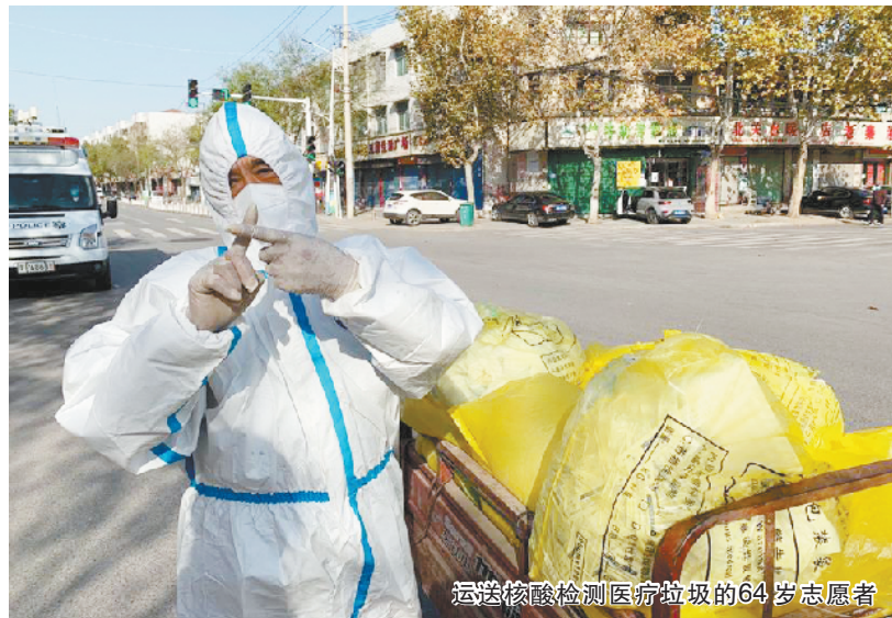
运送核酸检测医疗垃圾的 64 岁志愿者

下午 1 点半,我们去社区采访志愿者。中间有一个小插曲,令我印象深刻。昨天我遇到了一个开着拖拉机拉抗疫物资的“大白”(身穿防护服全副武装的工作人员),但是未能 6 追上,一直很遗憾。小何在路边等待采访对象时,又看到了一个“大白”开着电动三轮车运送物资,在我还没反应过来时,她拔腿就跑,边跑边喊,追了两条街,终于追上了。“小何跑得真快啊,我开车都追不上。”轩洋佩