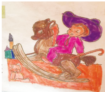
小记者:田浩远 证号:210012 周口五一路小学二(5)班