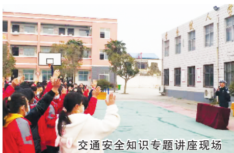
交通安全知识专题讲座现场