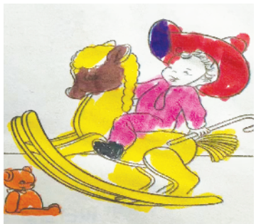
小记者:邓梓浩 证号:210517 周口李庄小学二(4)班