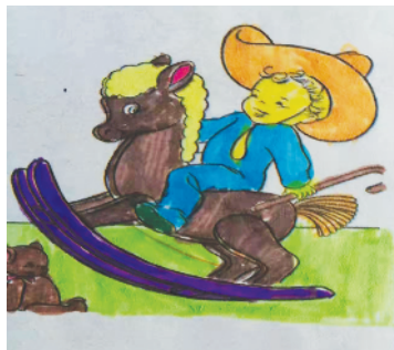
小记者:杨瑞羽 证号:210189 周口五一路小学二(7)班