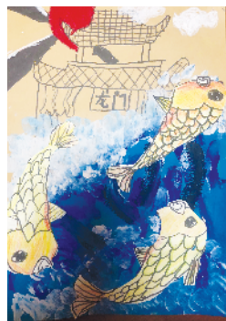
小记者:王泽昕 证号:211051 周口闫庄小学三(1)班