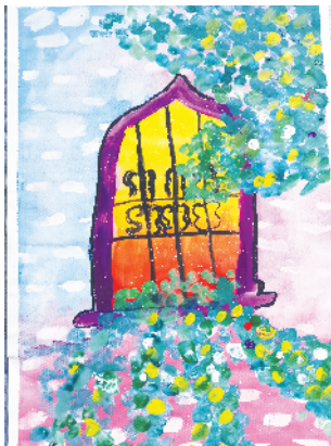
小记者:胡涵婉 证号:210266 周口五一路小学三(3)班