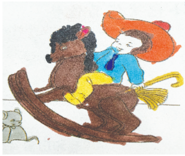
小记者:许朗 证号:210572 周口李庄小学二(7)班