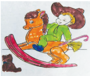
小记者:王子依 证号:210198 周口五一路小学二(7)班