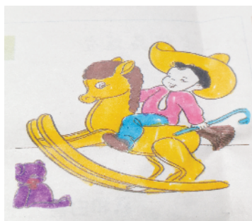
小记者:孙文悦 证号:210520 周口李庄小学二(4)班