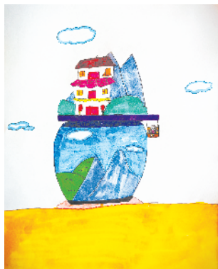
小记者:张雨暄 证号:210276 周口五一路小学三(5)班