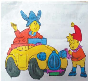
小记者:李嘉睿 证号:210190 周口五一路小学二(3)班