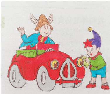
小记者:马康雅 证号:210239 周口五一路小学三(5)班