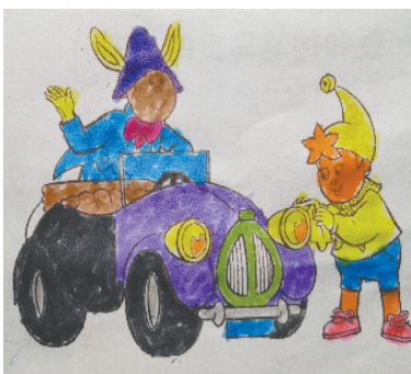
小记者:宋子晨 证号:210495 周口李庄小学二(3)班