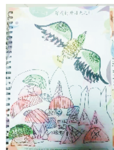
小记者:轩子睿 证号:210476 周口李庄小学二(2)班