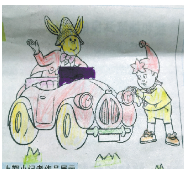
小记者:陈诺依 证号:210562 周口李庄小学二(7)班