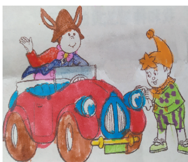
小记者:张越涵 证号:210490 周口李庄小学二(3)班