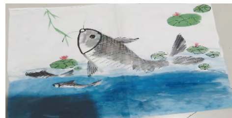
小记者:吴志东 证号:210289 周口五一路小学三(1)班