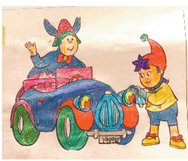
小记者:宋语嫣 证号:210580 周口李庄小学二(7)班