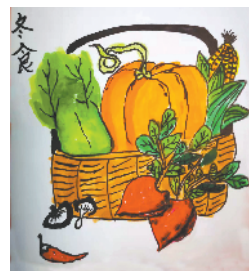
小记者:祁梓淇 证号:211073 周口闫庄小学三(8)班