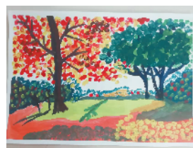
小记者:普沛琪 证号:210123 周口经济开发区 开元路小学四年级