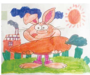
小记者:田浩远 证号:210012 周口五一路小学二(5)班