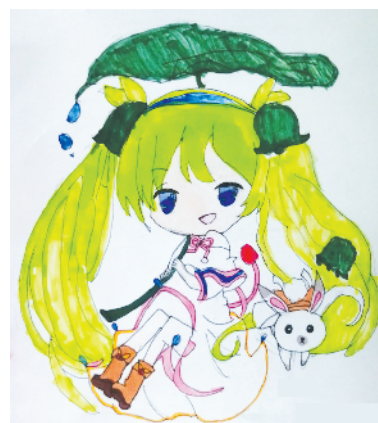
小记者:许伊诺 证号:211261 周口纺织路小学二(3)班 (辅导老师:陈利娟)