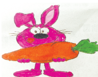
小记者:许朗 证号:210572 周口李庄小学二(7)班