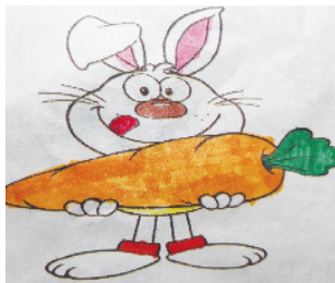
小记者:雷绍辉 证号:210532 周口李庄小学二(5)班