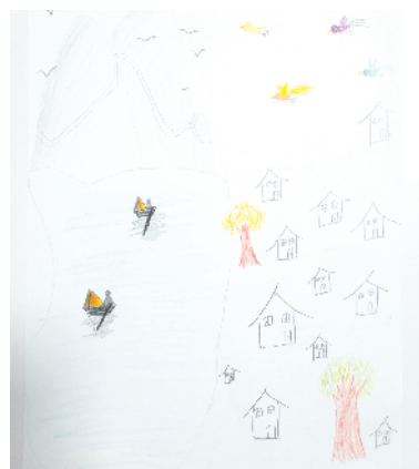
小记者:黄立言 证号:211008 周口闫庄小学二(1)班