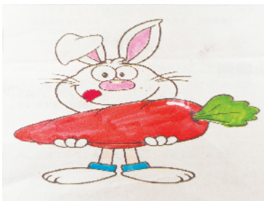
小记者:马康雅 证号:210239 周口五一路小学三(5)班