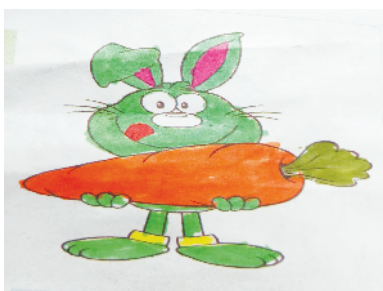
小记者:王泽昕 证号:211051 周口闫庄小学三(1)班