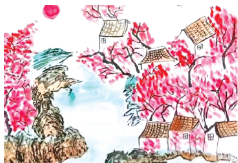
小记者：李馨雅 证号：211259 周口纺织路小学二（3）班 （辅导老师：陈利娟）