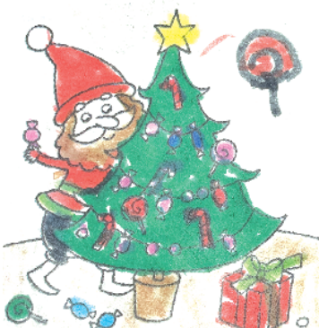
小记者：姚焯然 证号：211311 周口纺织路小学三（6）班