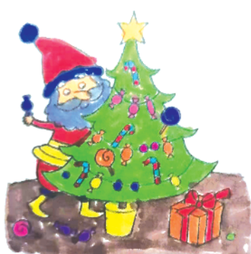
小记者：杨瑞羽 证号：210189 周口五一路小学二（7）班