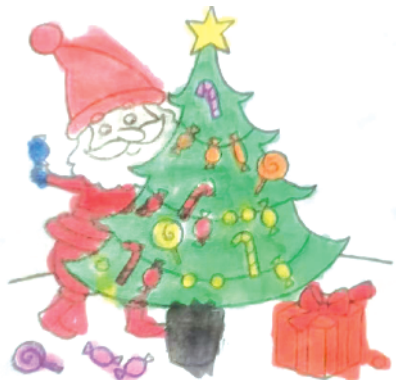
小记者：苑语桐 证号：210546 周口李庄小学二（5）班