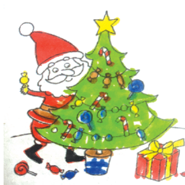
小记者：张伊诺 证号：212871 周口经济开发区实验学校二（1）班