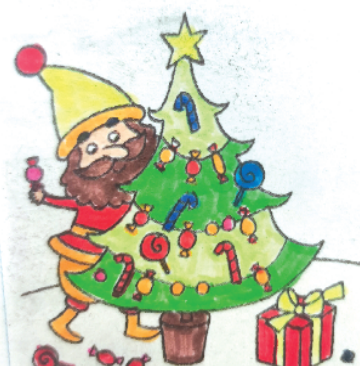
小记者：陆楚霖 证号：210543 周口李庄小学二（5）班