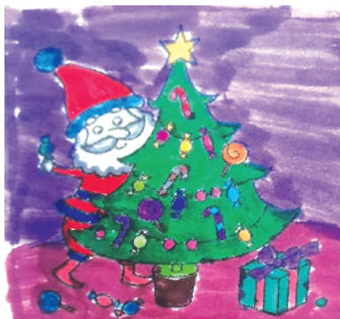
小记者：王子依 证号：210198 周口五一路小学二（7）班