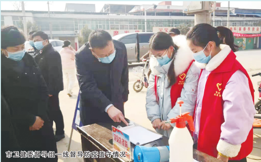
市卫健委督导组一线督导防疫值守情况

万家灯火时，团圆欢聚日。周口的壬寅年春节，正是因为有无数个他们坚守岗位，默默付出，才有了全市人民的岁月静好。③2