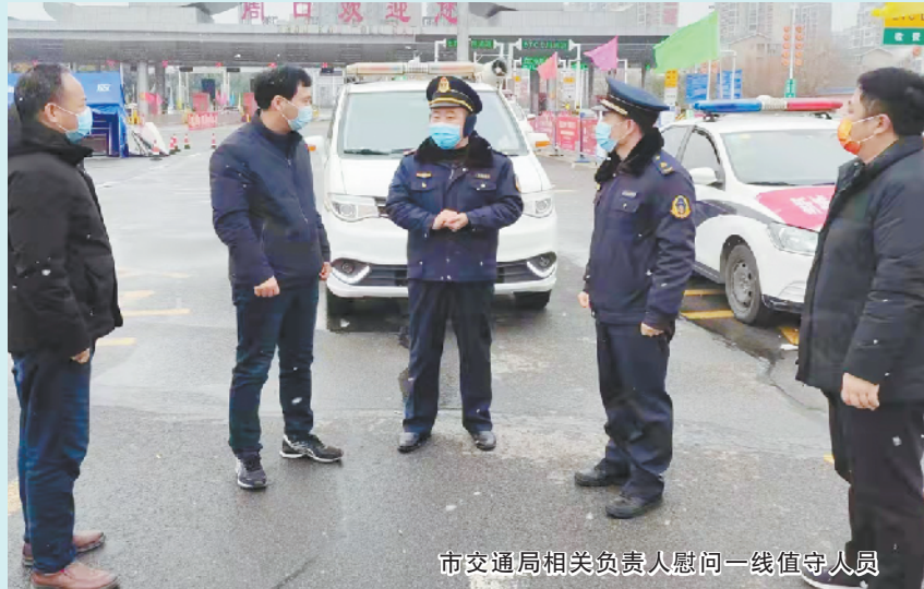
市交通局相关负责人慰问一线值守人员