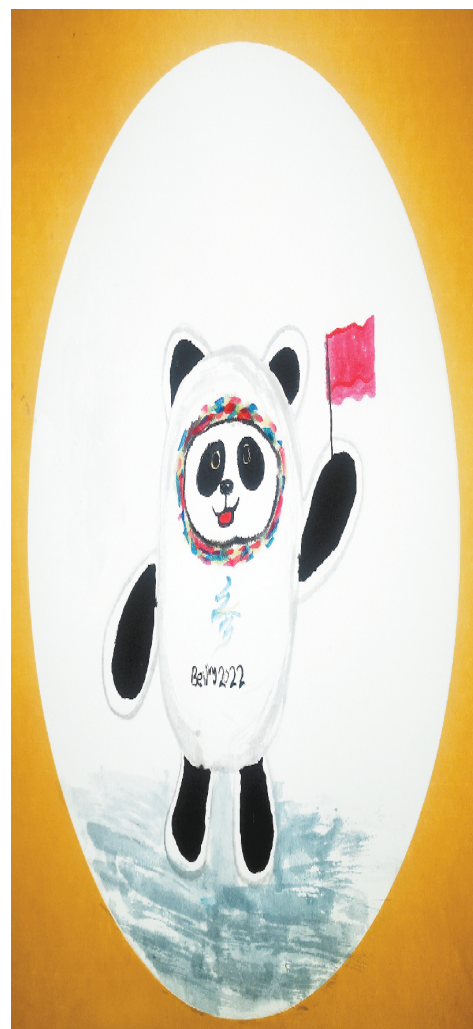
小记者:祁梓淇 证号:220758 周口闫庄小学三(8)班 (辅导老师:王亚杰)