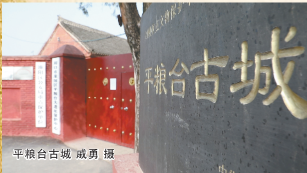
平粮台古城