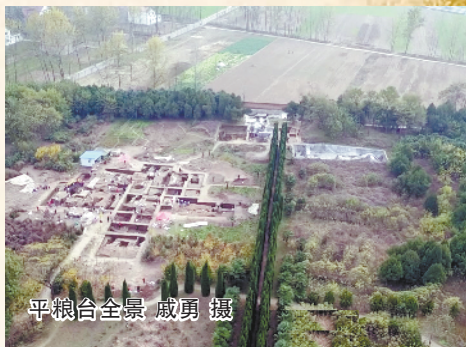
平粮台全景