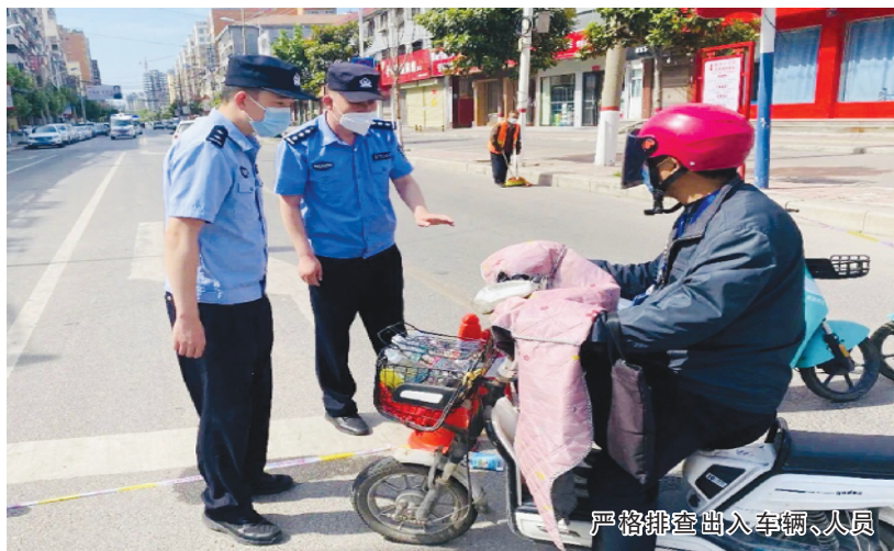
严格排查出入车辆、人员