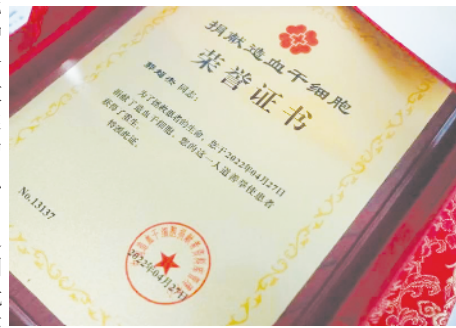
中国造血干细胞捐献者资料库管理中心颁发的荣誉证书