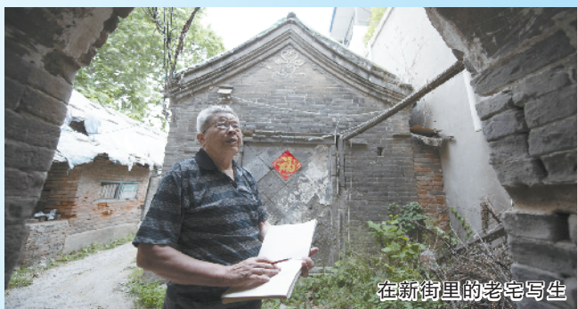
在新街里的老宅写生