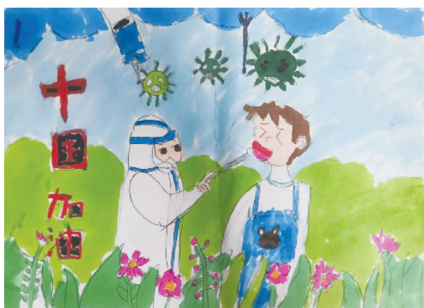
小记者:豆思源 证号:220505 一(5)班