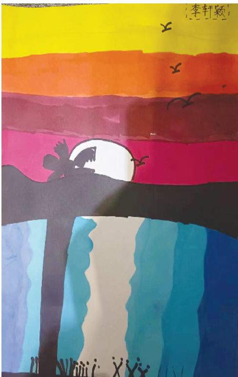
小记者:李轩颖 证号:220475 一(2)班