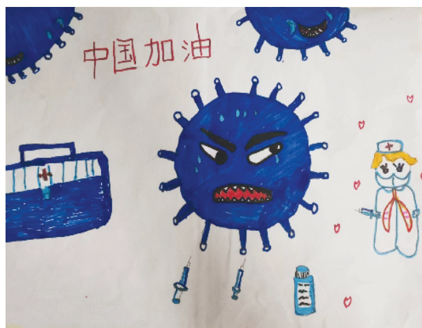
小记者:刘熠沐 证号:220506 一(5)班