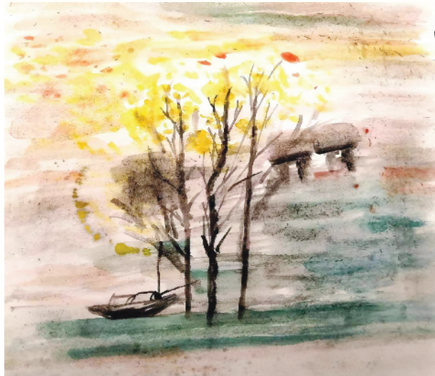
小记者:赵悦彤 证号:220473 一(2)班