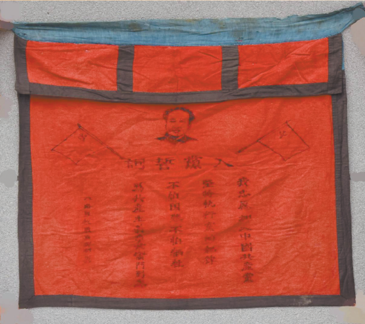
资料图·八路军抗战指挥部制入党誓词旗帜

记者了解到，项城德高民俗博物馆除了红色藏品外，还有各个历史时期的旧物件多达51600多件，分成43个类别展出，以记录不同时代的历史、文化、民俗、民风。2021年，项城德高民俗博物馆被国家文物局批准为国家三级博物馆，并成为周口市2022年重点项目而实施建设。