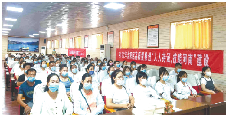
养老护理员及准养老护理员在听课