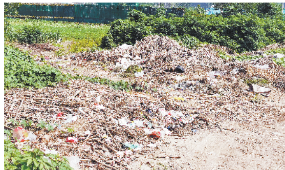
港区李埠口办事处交通大道东段川东石油加油站对面路边存在多处生活垃圾、秸秆、废弃物堆积现象