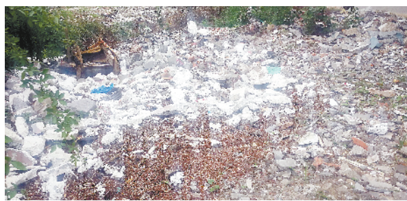
黄泛区中心西路与西环路交叉口存在建筑垃圾、生活垃圾和杂物堆积现象