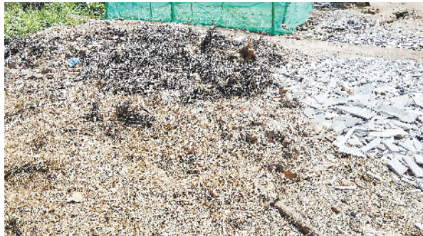
港区李埠口办事处田楼村村西路边存在堆积秸秆、废弃物现象