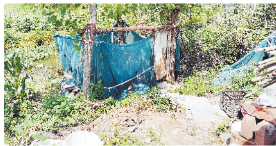
示范区许湾办事处西张庙村村内坑塘边存在堆积大量秸秆和杂物现象,坑塘边有一处露天旱厕