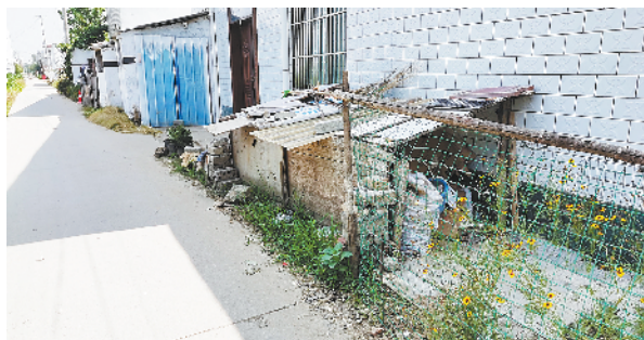
示范区许湾办事处尚楼村村西路边存在私搭乱建现象