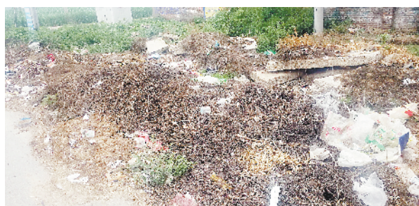
黄泛区农场东环路与省道329交叉口向南50米存在建筑垃圾、生活垃圾和杂物堆积现象