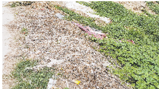
示范区许湾办事处008乡道边存在多处秸秆、废弃物堆放现象