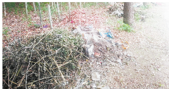
黄泛区农场东环路道路沿线存在树枝秸秆、生活垃圾和杂物堆积数十米现象