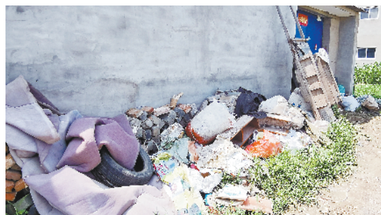
示范区许湾办事处东翟桥村村北居民屋后存在垃圾和废弃物堆放现象