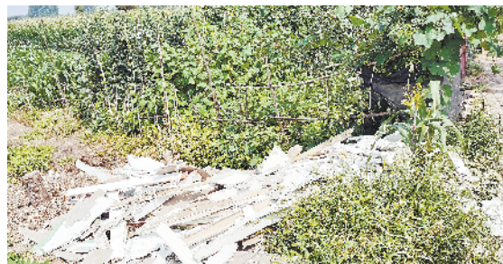
港区李埠口办事处西小楼村村西南路边存在堆积废弃物现象