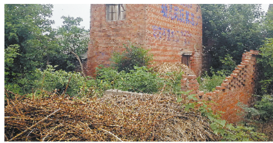
黄泛区农场尹坡村村口存在大量陈年垃圾长期无人清理现象,有一处残垣断壁