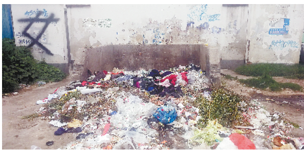
黄泛区农场交通路公厕前有一处露天垃圾存放点,存在垃圾存放不规范,大量生活垃圾堆积现象