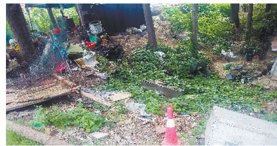
黄泛区农场东国道344与县道006交叉口附近沟内存在大量陈年垃圾、建筑垃圾和杂物现象