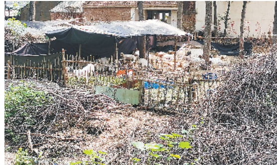
港区李埠口办事处田楼村中存在私搭乱建现象