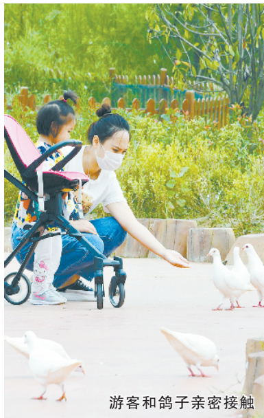
游客和鸽子亲密接触