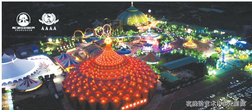
夜晚的艺术中心大剧院