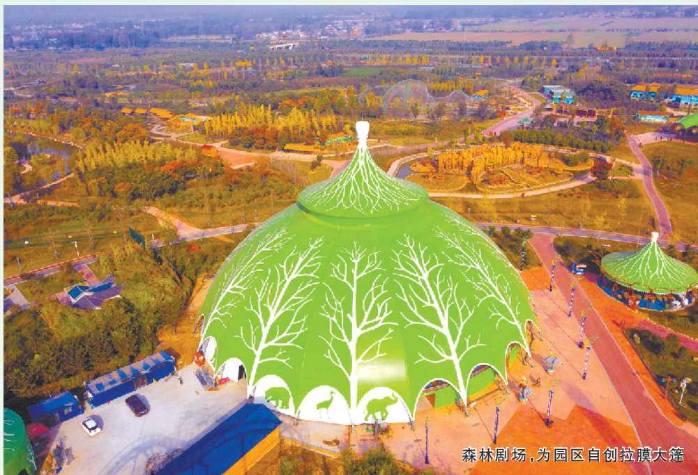
森林剧场，为园区自创拉膜大篷