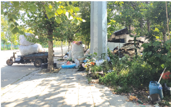
郸城县洛北街道办事处曹董庄村北侧废品收购站,机动三轮车严重占道,有垃圾堆放