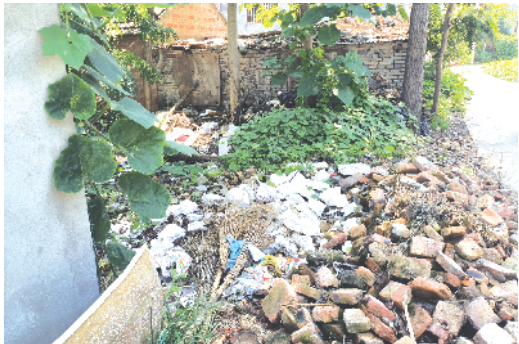
郸城县洛北街道办事处曹董庄村内道路东侧,有建筑垃圾堆积