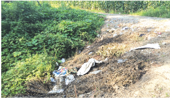
郸城县宁平镇卢楼村西侧沿路一侧有垃圾等杂物