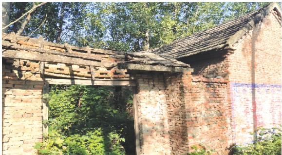
郸城县宁平镇卢楼村北侧有荒芜院落,需整改