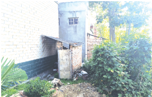
郸城县宁平镇陈庄村内有两处户外简易旱厕