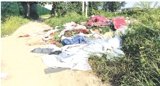
周口经济开发区五一路万达广场南 200 米铁路桥东侧有各种垃圾