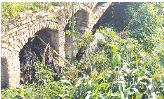
郸城县宁平镇陈庄村西侧桥下杂物堆积,水面有各类垃圾漂浮