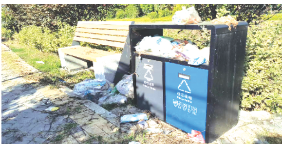
周口经济开发区春晖路与南六路交叉口西侧沿河垃圾点,垃圾没有及时清理,有垃圾溢出