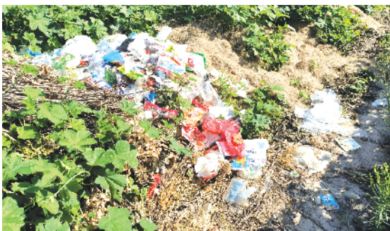
周口经济开发区南六路周口万达公园正对面有大量垃圾及秸秆堆放