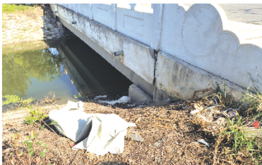
周口经济开发区许寨社区桥下存在生活垃圾