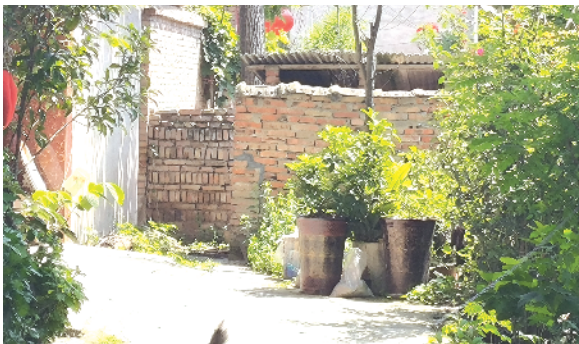
郸城县洛北街道办事处马胡庄村南侧存在户外旱厕