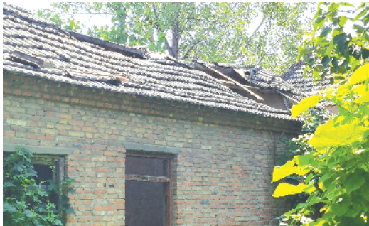
郸城县洛北街道办事处马胡庄村,有一间破损房屋