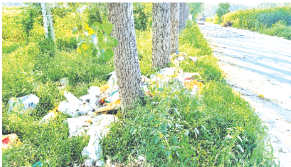
周口经济开发区太昊路办事处 Y009 道路冯庄段路两侧存在大量垃圾