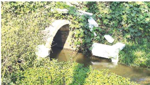
周口经济开发区五一路南段东侧河沟内有大量垃圾及秸秆