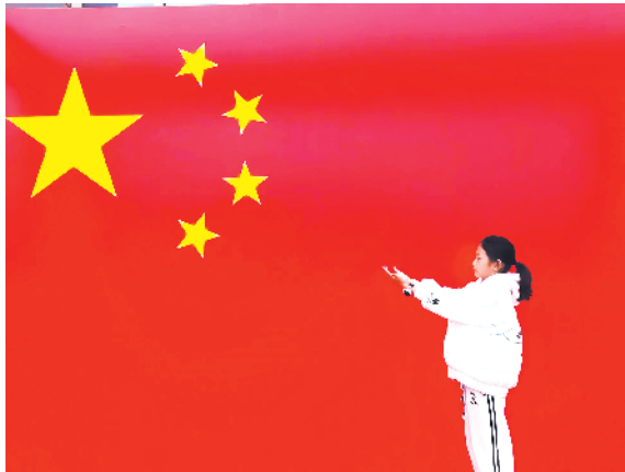
小记者：刘奕彤 证号：222758 周口市文昌小学三(10)班

10月1日，我在周口游泳馆门前与国旗合影。当天，我正式加入周口市游泳队。希望有一天，我能成为游泳冠军，为祖国争光，为国旗添彩！