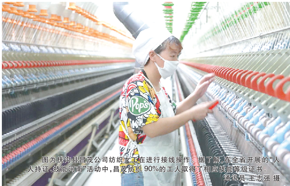
图为扶沟县昌茂公司纺织女工在进行接线操作。据了解，在全省开展的“人人持证、技能河南”活动中，昌茂纺织90%的工人取得了相应技能等级证书。

今年以来，我市高效统筹疫情防控和经济社会发展，精准施策，全力保运行促发展。全市上下深入贯彻省委、市委“万人助万企”活动推进会议精神，锚定“两个确保”，实施“十大战略”，聚焦“八个深化”，抓调度稳运行、抓创新促合作、抓产业挖潜能、抓服务优环境，全市经济持续恢复、稳定向好。