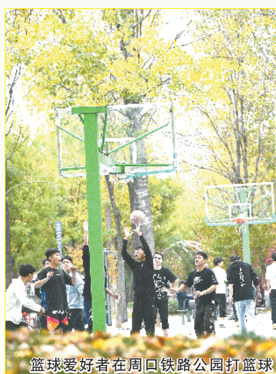
篮球爱好者在周口铁路公园打篮球