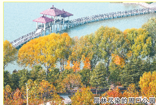
层林尽染的周口公园