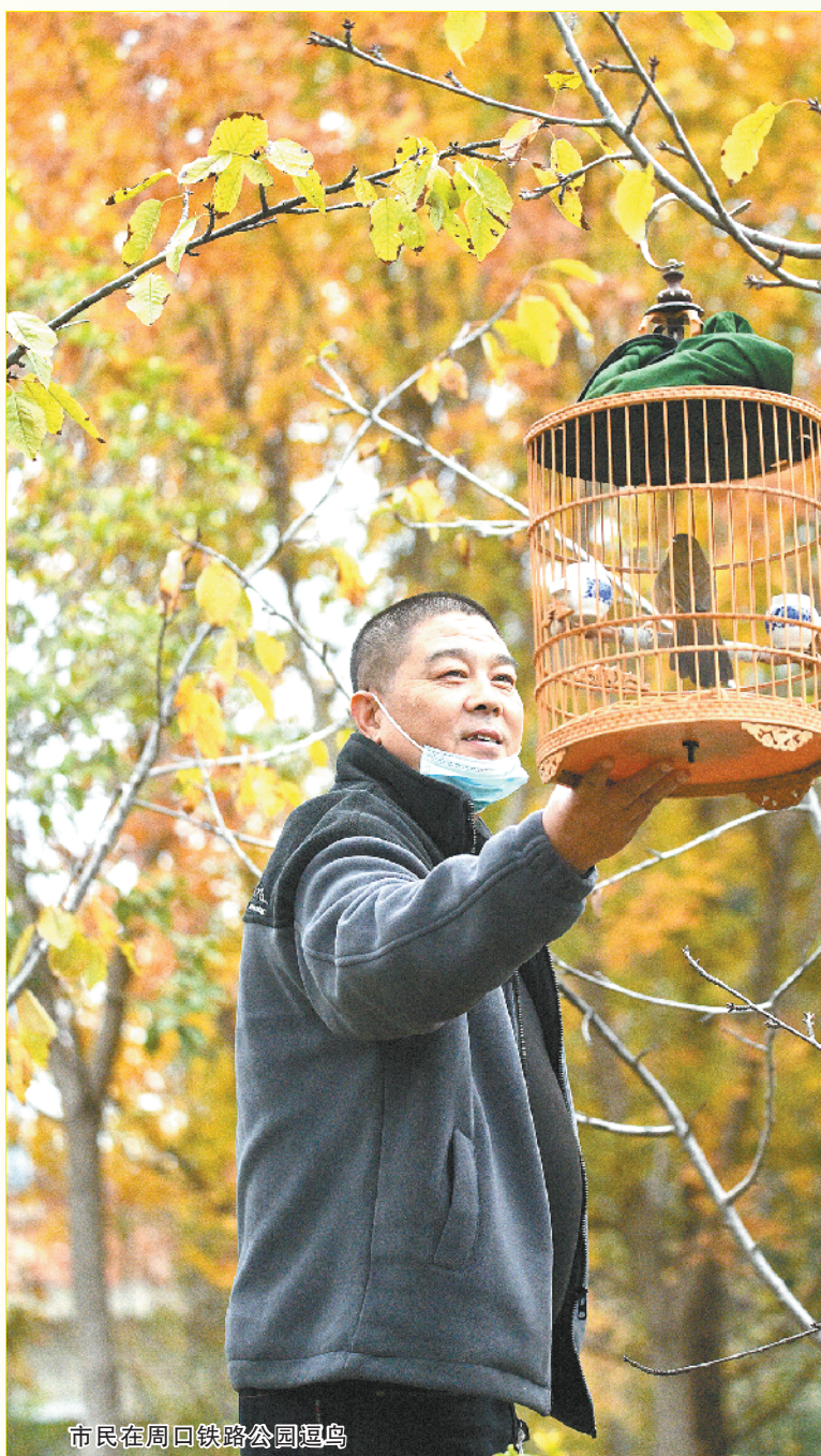
市民在周口铁路公园逗鸟