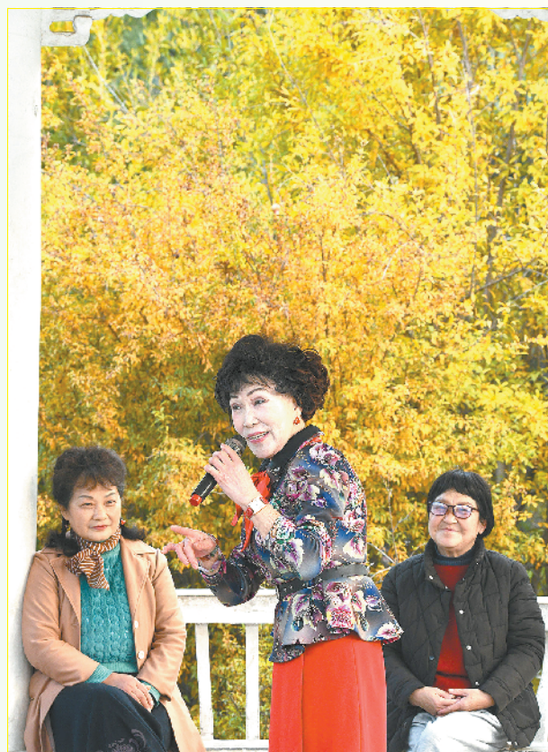
戏迷爱好者在风景如画的周口滨河公园红歌亭表演

大自然以热情之手，将周口生态之美、城市之美、人文之美自然融合，相互辉映，展示了“临港新城 开放前沿”“道德名城 魅力周口”的美丽风情。②16