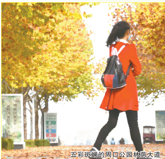
五彩斑斓的周口公园林荫大道