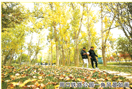
周口铁路公园一角风景如画