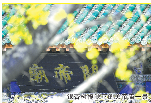
银杏树掩映下的关帝庙一景