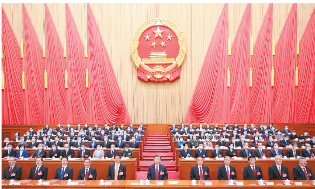
3月13日,第十四届全国人民代表大会第一次会议在北京人民大会堂闭幕。习近平等党和国家领导人在主席台就座。

新华社北京3月13日电 中华人民共和国第十四届全国人民代表大会第一次会议,在圆满完成各项议程,产生新一届国家机构组成人员后,13日上午在北京人民大会堂闭幕。