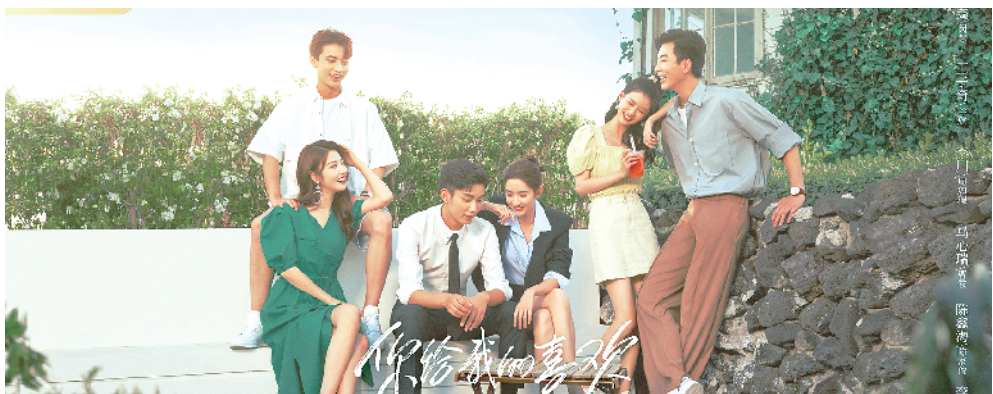
《你给我的喜欢》海报