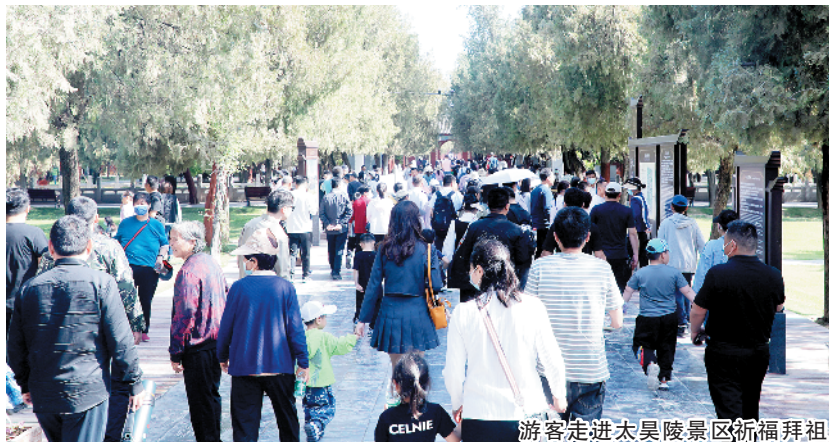
游客走进太昊陵景区祈福拜祖