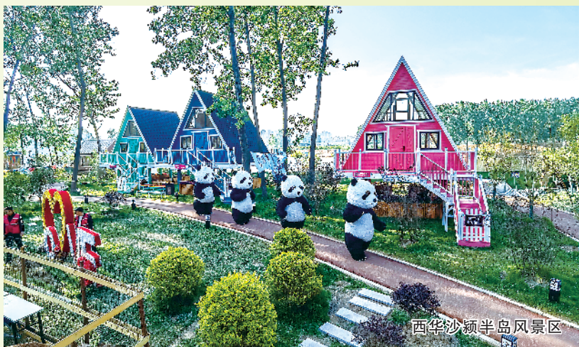
西华沙颍半岛风景区