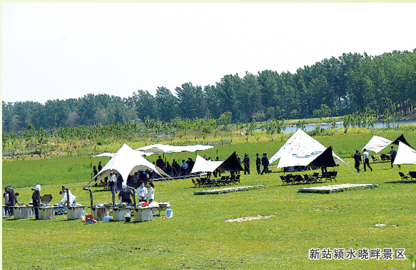
新站颍水晓畔景区

红闸湿地公园项目位于沈丘县沙颍河上游，S102 以南，西起县城边界的西北角，东至颍河大道，沿线长约 8km，包含颍河八景旅游风光带、水文化体验主题乐园、农耕文化体验主题乐园、沙北总干渠水生态修复、入园通景大道等。打造以水上蹦床、皮划艇游、游船赏景等为主，结合现状水系的水文化主题乐园；打造游客可参与的家庭农场，提供“开心农田”私人认领场地，供游客租赁，自种自收，体验田园乐趣的农耕文化主题园。红闸自 1952 年建设历史为切入点，深入挖掘红闸乃至全国历史上多方水利文化，讲好红闸水利英雄故事，宣扬并传承红色水利文化精神。②16