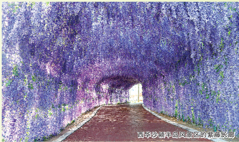
西华沙颍半岛风景区的紫藤长廊