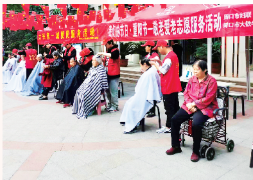
志愿者为社区老人义务理发。