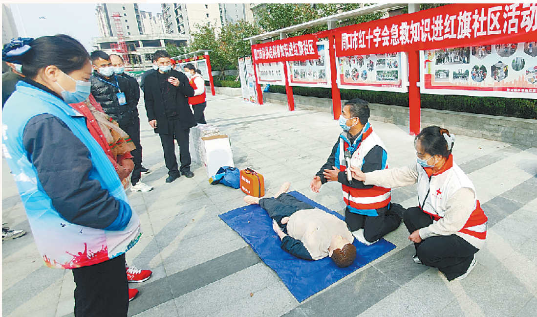
医护人员向社区居民宣传急救常识。

2017年以来,申华船舶制造有限公司生产各类船舶200多艘,维修船舶70余艘,形成了船舶制造、船舶维修、生活保障体系,为周口航运事业发展打下了坚实基础。