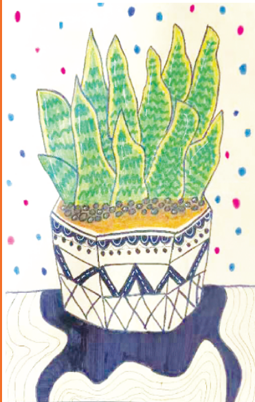
小记者:姚孟阳 周口市六一路小学四(3)班 (辅导老师:郭孟华)