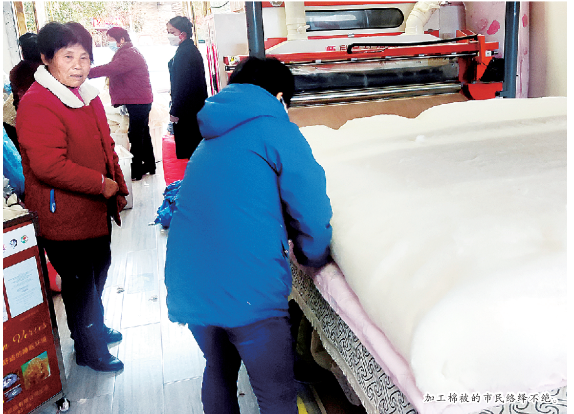
加工棉被的市民络绎不绝。