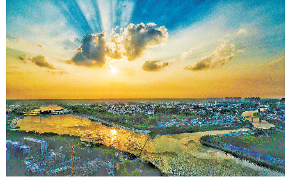
彩云之下的三川大地。