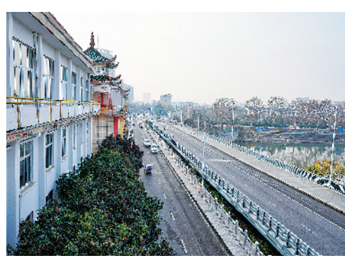
交通繁忙的汉阳路。