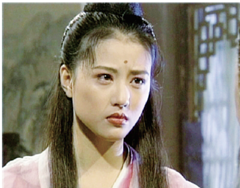
周海媚在《倚天屠龙记》中饰演周芷若。