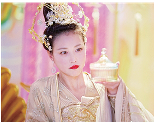
周海媚在《香蜜沉沉烬如霜》中饰演茶姚。