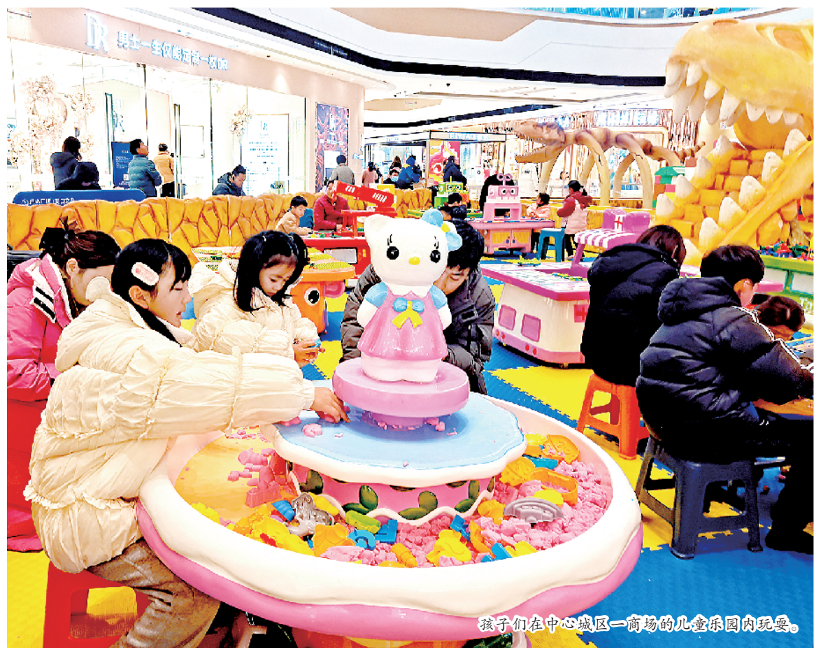
孩子们在中心城区一商场的儿童乐园内玩耍。