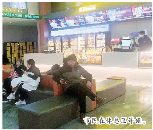
市民在休息区等候。