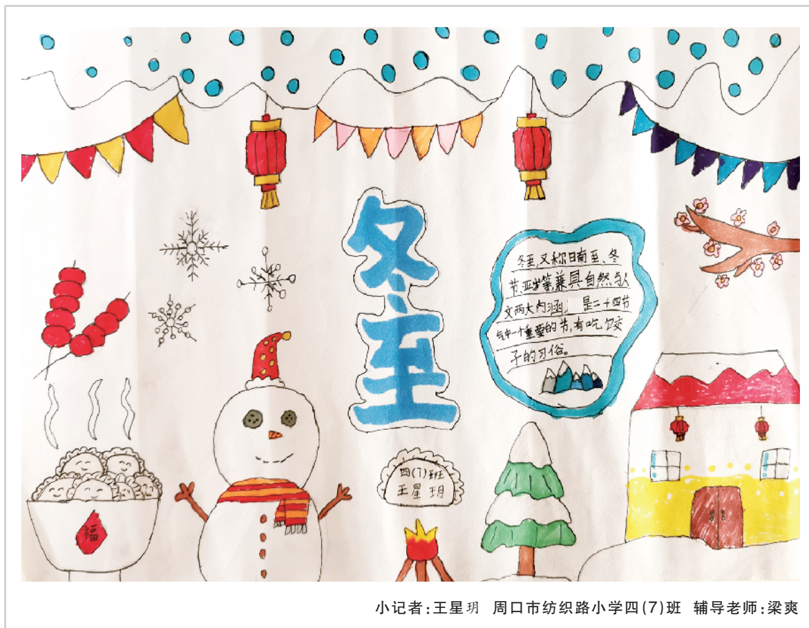
小记者:王星玥 周口市纺织路小学四(7)班 辅导老师:梁爽

我们今天的幸福生活,是像老班长这样有自我牺牲精神的千千万万红军战士用生命换来的,我们一定要珍惜现在的幸福生活,为中华民族更美好的明天而努力奋斗,做一个和老班长一样舍己为人、坚强乐观、忠于职守的人。(辅导老师:高运芳)