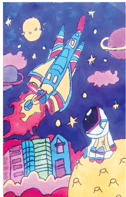
小记者:于卓冉 周口市六一路小学二(5)班 辅导老师:辛锦