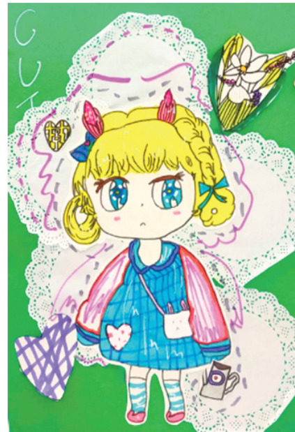
小记者:徐嘉琪 周口市六一路小学三(4)班 辅导老师:杨亚