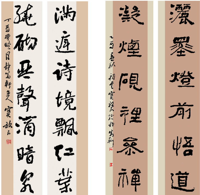
行书对联 满庭诗境飘红叶 绕砌琴声滴暗泉