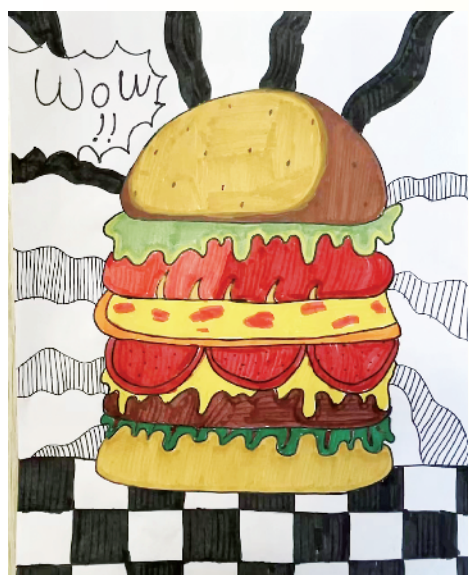
小记者:孙蓝琪 四(3)班 辅导老师:贾爽