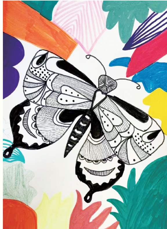
小记者:张嘉琪 五(1)班 辅导老师:刘田梦