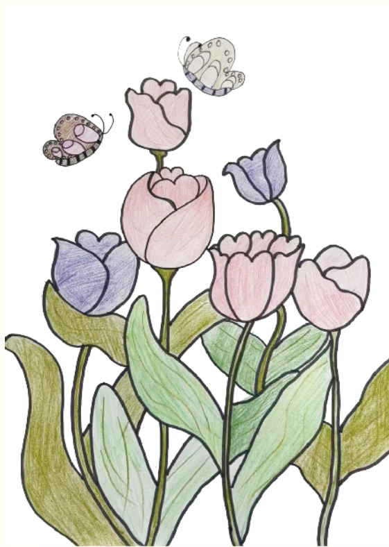
小记者:朱雨晴 五(4)班 辅导老师:刘田梦

春天是万物复苏的季节,处处洋溢着生机与活力,让人陶醉其中、流连忘返。愿我们沉浸在这美丽的春色中,感受生命的美好与珍贵。 (辅导老师:刘秋红)